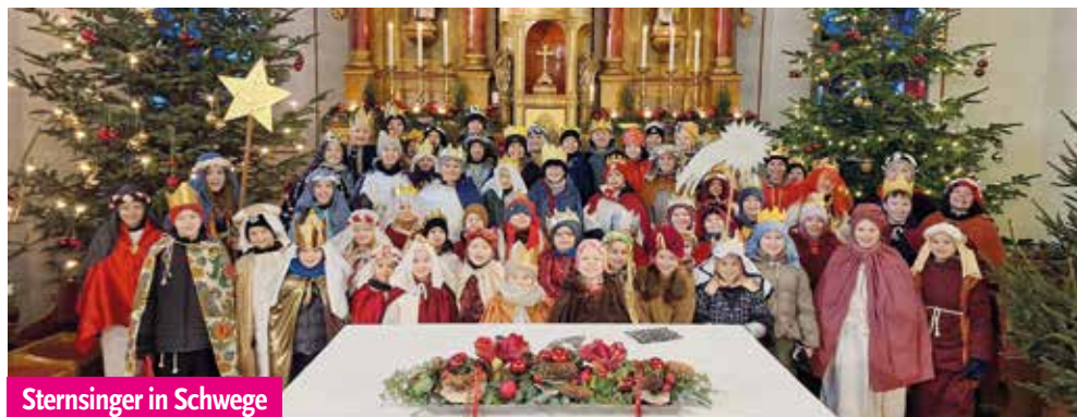
Sternsinger in Schwege