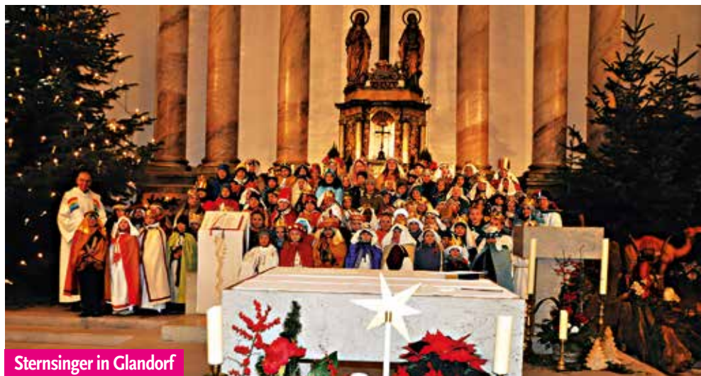
Sternsinger in Glandorf