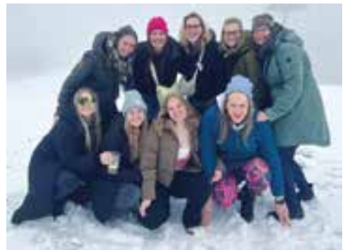
Die Damengarde in Willingen