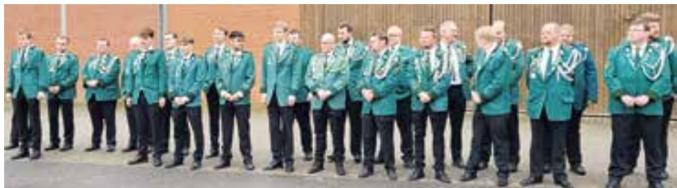
Die Königswache bei der Amtsübergabe